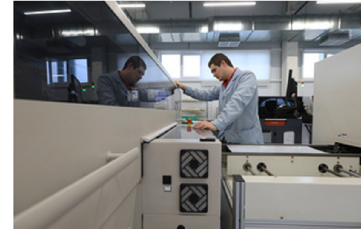
WorldSkills и цифровая экосистема: как изменится нацпроект по повышению производительности труда