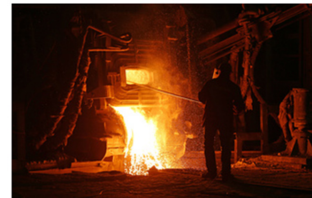
Производительность на старейшем заводе металлоконструкций в Кузбассе выросла на 10%