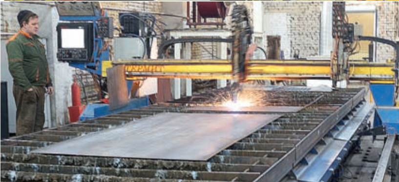
Цех раскрой и резки металла