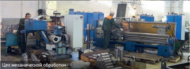
Цех механической обработки