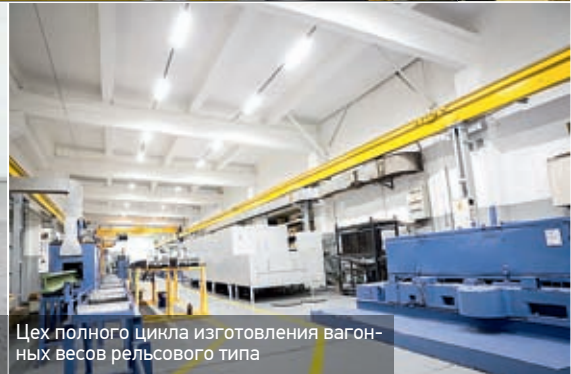
Цех полного цикла изготовления вагонных весов рельсового типа