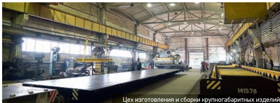
Цех изготовления и сборки крупногабаритных изделий