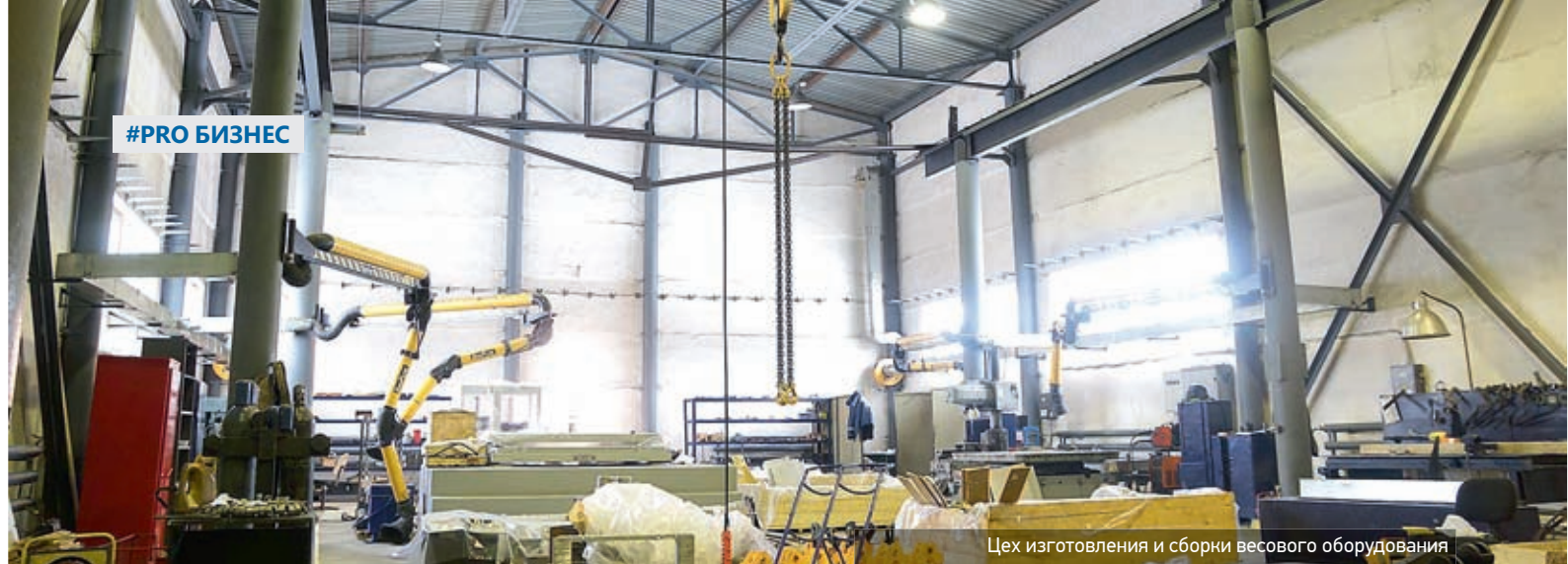
Цех изготовления и сборки весового оборудования